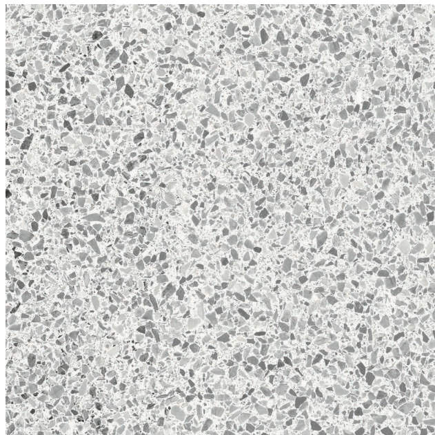
PERLE - Fini mat