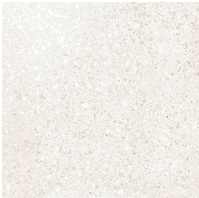
BLANC - Fini mat