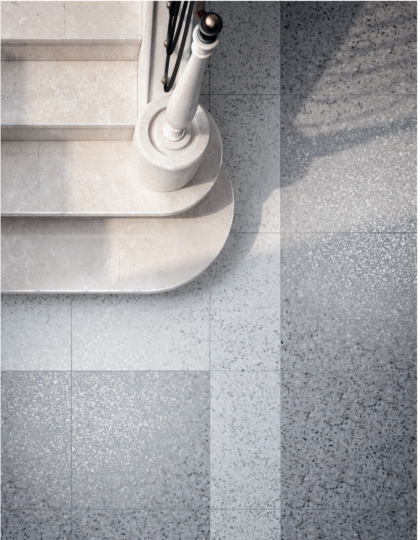
GRIS & PERLE