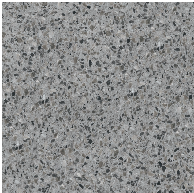
GRIS - Fini mat